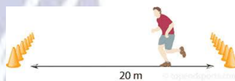
Gambar 3.1 tes MFT

https://www.topendsports.com/testing/beephone.htm