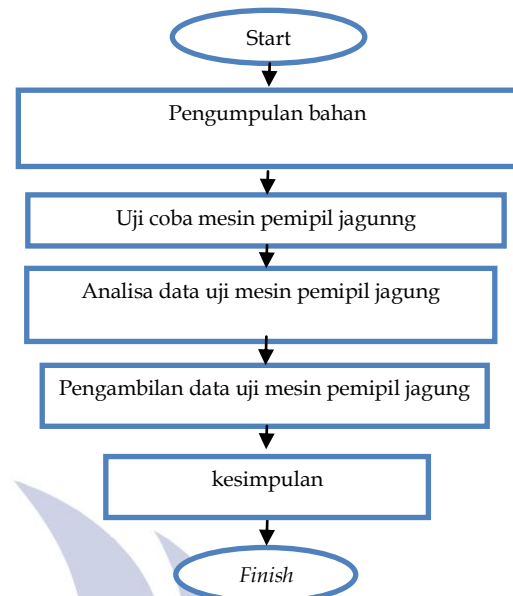
Gambar 1. Flow Chart Penelitian.

Proses merontokan jagung membutuhkan keterampilan dan pengalaman tersendiri. Waktu yang dibutuhkan untuk memisahkan biji jagung dari bongkolnya cukup lama. Belum lagi sulitnya mendapat pekerja yang mau melakukan pekerjaan seperti ini. Jika musim panen tiba, untuk memipil jagung dengan kapasitas yang banyak akan menjadi kendala. Salah satu solusi untuk mengerjakan pekerjaan seperti ini adalah dengan memanfaatkan peralatan atau teknologi yang tersedia.