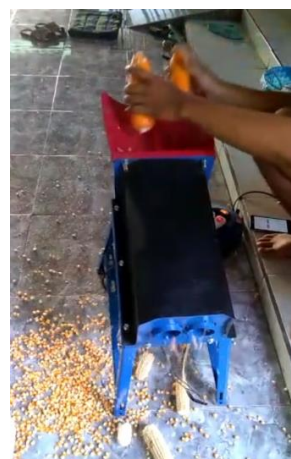
Gambar2 : Cara Memasukkan Jagung

Kegunaan blower tersebut untuk meniup kotoran bonggol jagung yang hancur kecil-kecil biar tidak tercampur dengan biji jagung yang akan jatuh pada wadah yang telah tersedia dibawahnya.