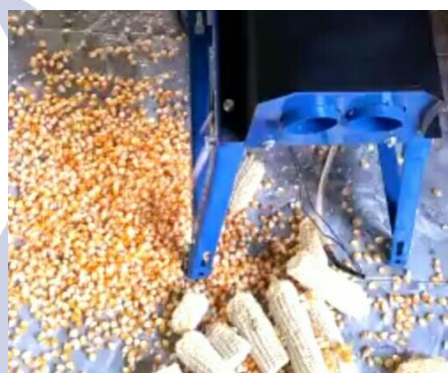
Gambar 3: Hasil Pemipilan Jagung

Hasil pemipilan menghasilkan kapasitas produksi dengan jumlah produksi 360 kg/jam hasilnya bersih. Kualitas hasil pemipilan bagus tidak ada yang pecah biji jagung, hasilnya bersih bonggol jagung yang keluar tidak banyak jagung yang menempel di bonggol jagung. Bonggol jagung yang keluar juga tidak banyak yang pecah jadi tidak banyak yang tercampur pada biji jagung.