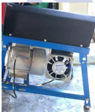
Gambar 1: Blower untuk Membersihkan Kotoran

Dari data hasil pengujian mesin pemipil jagung tersebut dapat diketahui bahwa, hasil pemipilan menghasilkan kapasitas produksi dengan jumlah produksi 360 kg/jam dengan putaran 2800 rpm tapi hasilnya kurang bersih masih ada bonggol yang ikut hancur jadi kurang maksimal.