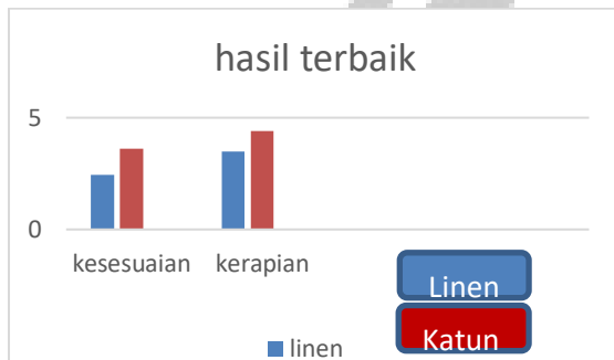
Gambar 3. Diagram hasil terbaik

Dari diagram batang dapat dilihat bahwa hasil jadi lining pada kain katun dan linen dari aspek kesesuaian dan kerapian memperoleh mean tertinggi adalah katun