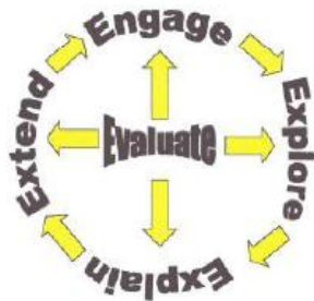
Gambar 1. Model Pembelajaran Learning Cycle 5E

Berdasarkan tahapan-tahapan dalam model pembelajaran learning cycle 5E yang telah dipaparkan di atas, diharapkan siswa tidak hanya mendengar keterangan guru, tetapi juga dapat berperan aktif untuk menggali dan memperkaya pemahaman mereka terhadap konsep-konsep yang dipelajari (Shoimin, 2014). Kelima tahapan siklus belajar 5E dapat digambarkan seperti dibawah ini.