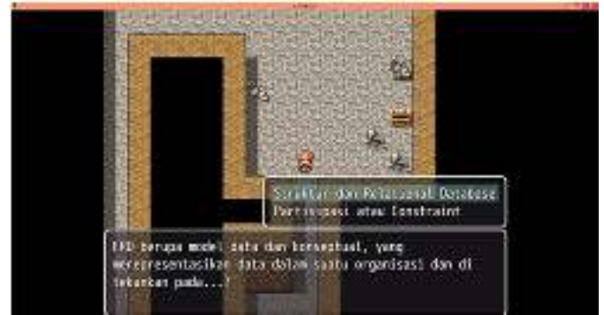
Gambar 8. Tampilan Soal