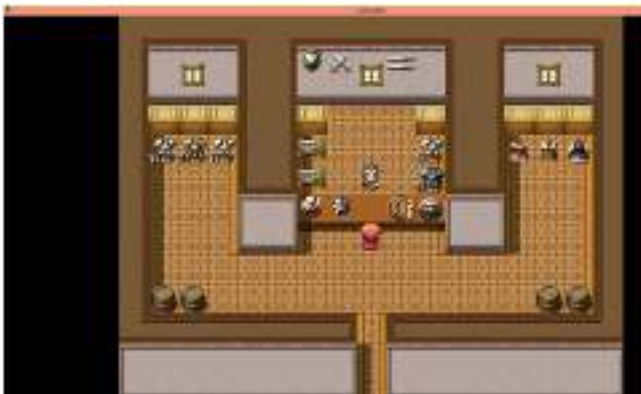
Gambar 6. Tampilan Toko Perlengkapan Senjata

Tampilan materi ketika pemain berinteraksi dengan karakter pendukung yang memberikan informasi seperti Gambar 7 berikut ini.