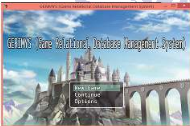
Gambar 1. Tampilan awal

Tampilan halaman awal ketika game ini dijalankan. Pada halaman ini disajikan logo SiKamus seperti Gambar 1 berikut.