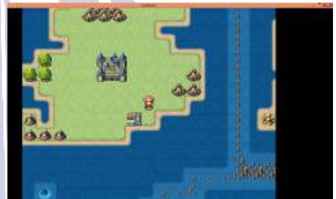
Gambar 3. Tampilan Peta Pada Game

Setelah tampilan petunjuk pada game relational database management system atau disingkat gerimys akan disajikan tampilan peta dalam game seperti pada Gambar 3 berikut: