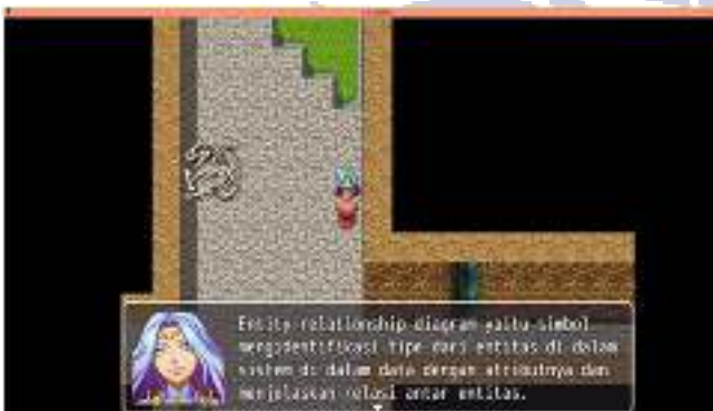
Gambar 7. Tampilan Materi Pada Game

Tampilan materi ketika pemain berinteraksi dengan karakter pendukung yang memberikan informasi seperti Gambar 7 berikut ini.