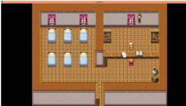
Gambar 5. Tampilan Hotel Pada Game