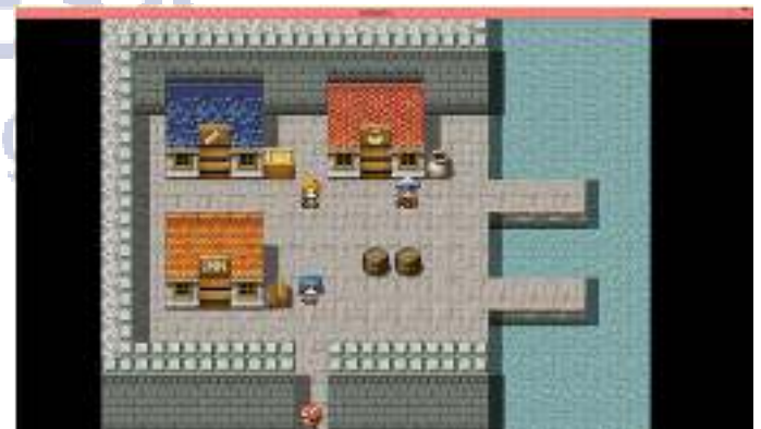
Gambar 4. Tampilan Kota Pada Game

Pada tampilan kota dalam game terdapat kebutuhan pemain dan informasi yang akan pemain dapatkan ketika berinteraksi dengan karakter lain. Tampilan tersebut dapat dilihat pada gambardapat dilihat pada Gambar 4 berikut.