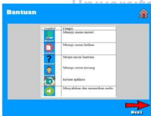
Gambar 5 Tampilan bantuan

Tampilan latihan ini akan memberikan empat soal praktik yang akan dikerjakan menggunakan aplikasi Scratch dan hasil dari soal praktik akan dinilai menggunakan Dr.Scratch .