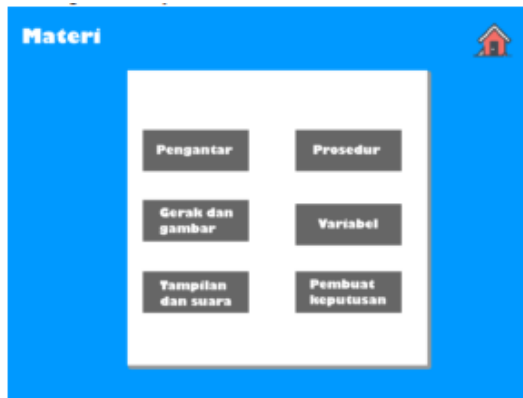
Gambar 3 Tampilan materi

memematikan suara, dan tombol keluar untuk keluar dari modul.