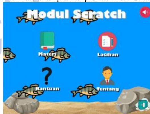
Gambar 2 Tampilan menu utama

Berikut ini adalah tampilan-tampilan dari modul Scratch :