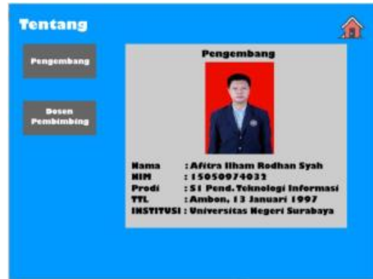
Gambar 6 Tampilan tentang

Tampilan bantuan akan menjelaskan tentang fungsi dari tombol yang ada di dalam modul dan penjelasan cara instalasi aplikasi Scratch .