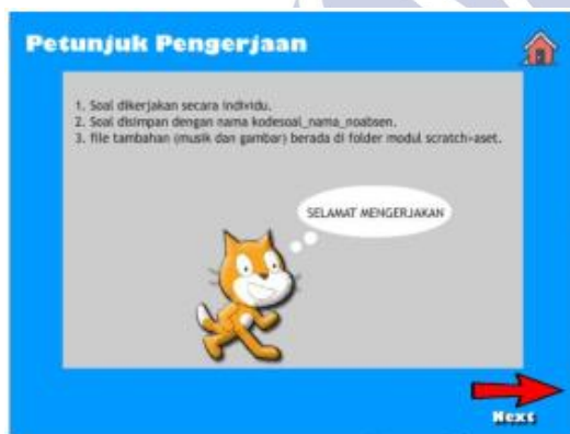
Gambar 4 Tampilan latihan

Pada halaman ini, akan muncul materi yang dijelaskan dalam modul Scratch jika tombol ditekan akan menuju materi yang dipilih dan jika menekan tombol home akan kembali ke menu utama.