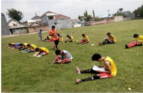
Gambar Tempat Pelaksanaan Ketepatan Tes Long passing